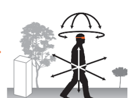
歩ける全天球動画